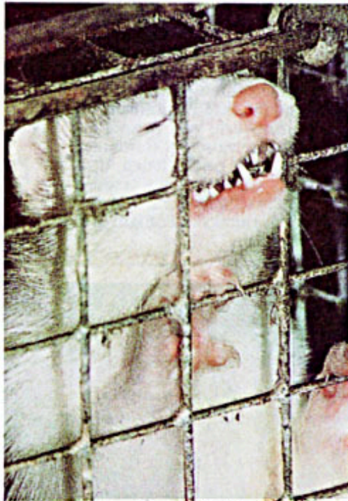
Mit sechs Monaten zur Schlachtung: Ein Nerz im Käfig (o.), typische Zuchtanlage in Norddeutschland